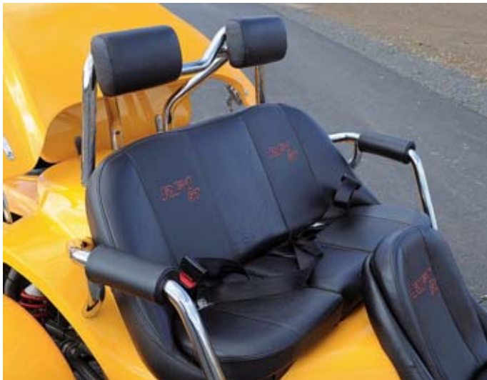
Flotter Dreier: In der ST-3-Variante bietet das Trike Fahrspaß für eine kleine Familie, die breite Bank kostet 590 Euro Aufpreis gegenüber dem Zweisitzer.